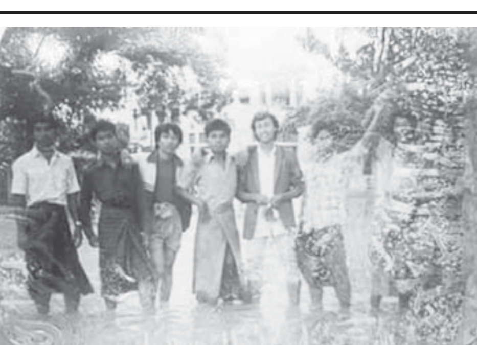
မန္တလေးမြို့၊ စံချိန်တင်ပိုးရွာသွန်းဆိုင်က မန္တလေးတက္ကသိုလ်မြင်ကွင်း(၁၉၈၅ ခုနှစ်)

အောင်မင်္ဂလာနဲ့ ရွှေပြည်အေးကြားမှာ တင်းနစ် ခန်းရုံတယ်။ အဲဒီတင်းနစ်ခန်းထဲမှာ ကောင်မလေး တစ်ယောက် သေဖူးတယ်။ သေရတဲ့အကြောင်း အရင်းကိုလည်း ပြောပြတယ်။ ညညဆို နှင်းဆီပန်း အနီလေးပန်း ပြုံးလမ်းလျှောက်နေတာ။ သူ့တို့ တွေဖူးတယ်။ ဒါကြောင့် အောင်မင်္ဂလာနဲ့ ရွှေပြည် အေးကို တင်းနစ်ခန်းပြတ်ပြီး ဘယ်သူမှ မကျွေးကြ ဘူးတဲ့။ ဟုတ်လား မဟုတ်လားတော့ မသိဘူး သူ့ပြောတာကို ပြန်ပြောပြရတာ။ စာရေးသူက တစ္ဆေ ခေါ်တုန်းက မိန်းမဆိုတာကို ပြန်သတိရပြီး ကြောက် လာတယ်။ အဲဒီညက ရှူးပေါက်တောင် မထွက်ရဲ ဘူး။ အောင်ထားရတယ်။ အားလုံးကို ပြန်ပြောပြ တော့ သူတို့လည်း ကြောက်ကြတာပေါ့။