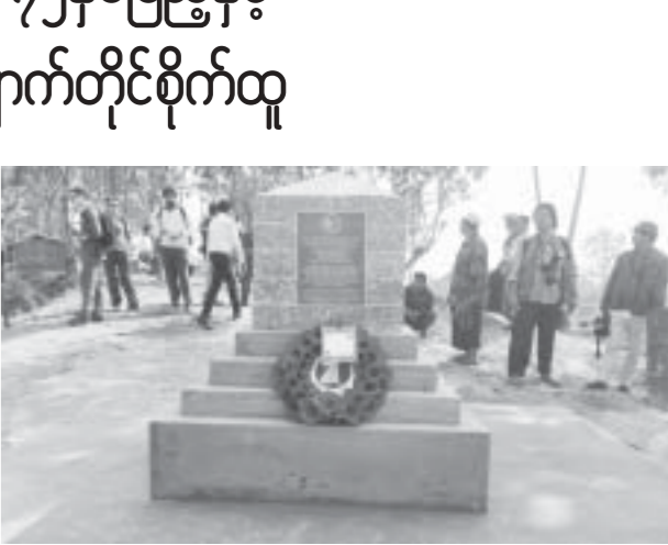
အောင်ဇေယျာ

အား ၁၂လက်မx၁၆လက်မအရွယ်ရှိ ကြေးပြားတပ်ဆင်ကာ (CHIN DITS Memorial Plate)စိုက်ထူခြင်းဖြစ်ကြောင်း၊ စိုက်ထူပွဲသို့ အင်းတော်နှင့်မော်လူးမြို့မှ အုပ်ချုပ်ရေးအဖွဲ့ဝင်များ၊ ကသာ၊ မော်လူးတို့မှ ဇွေးဟောင်းအမွေအနှစ်များ ထိန်းသိမ်းရေးအဖွဲ့ဝင်များ တင်ရောက်ကြကြောင်း သိရသည်။