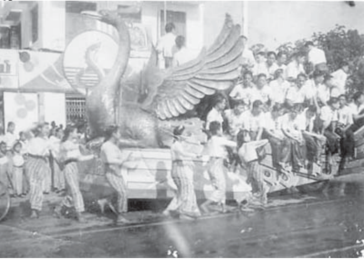
--- စ - ၁ မှ အ ဆ က် ---

ထိုလမ်းဆုံတွင် တစ်ချိန်က တတ်ရထားတွေ မောင်းနှင်ဖြတ်သန်းခဲ့ဖူးသည်။ အရှေ့ရုံးကြီးမှ ဂေါ်ပိန်း၊ ဘုရားကြီးစသည့်လမ်းကြောင်းများအတွက် ထိုလမ်းဆုံကို ဖြတ်သန်းကြသည်။ ဈေးချိုတော်သည် မန္တလေး၏ အသည်းနှလုံးဖြစ်ခဲ့သည်မို့ မည်သည့် အကြောင်းအရာဖြစ်စေ ဈေးချိုတော်ကိုဦးတိုက်ရပြန် ဖြစ်ပါ၏။ ထိုလမ်းဆုံတွင် ၁၃၀၀ ပြည့် အရေတော်ပုံ ကာလကလည်း ရဟန်းရှင်လှ ကျောင်းသားပြည်သူ တွေ ဖြတ်သန်းခဲ့ဖူးသည်။ ထိုအတူ စီမံကိန်းစီးပွား ရေးခေတ်ကလည်းနေ့ကြီး ရက်ကြီးအထိမ်းအမှတ် ပွဲများအတွက်လူထုစစ်ကြောင်းတွေ ဖြတ်သန်းခဲ့ ဖူးသည်။