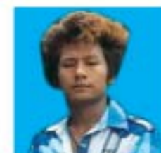
ကိုပိုင်ပိုင်ချစ်မောင် ၅/စကန(နိုင်)လ၁၁၇၅၇၁ စစ်ကိုင်းမြို့