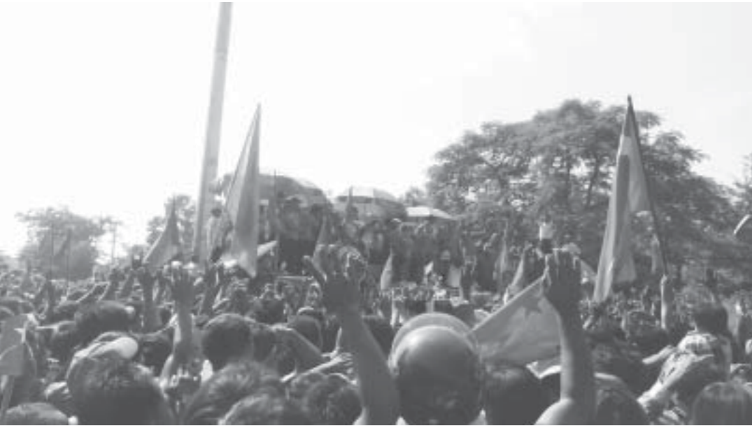
အောင်နိုင်ရေး အနုပညာရှင်၊ တေးသံရှင်များအဖွဲ့သည် အဆိုပါနေ့ ညနေပိုင်းတွင် မုံရွာမြို့မှတစ်ဆင့် ဘုတလင်မြို့သို့ သွားရောက်ကာ ဆက်လက် ဖျော်ဖြေ ကြမည်ဖြစ်ကြောင်းသိရသည်။