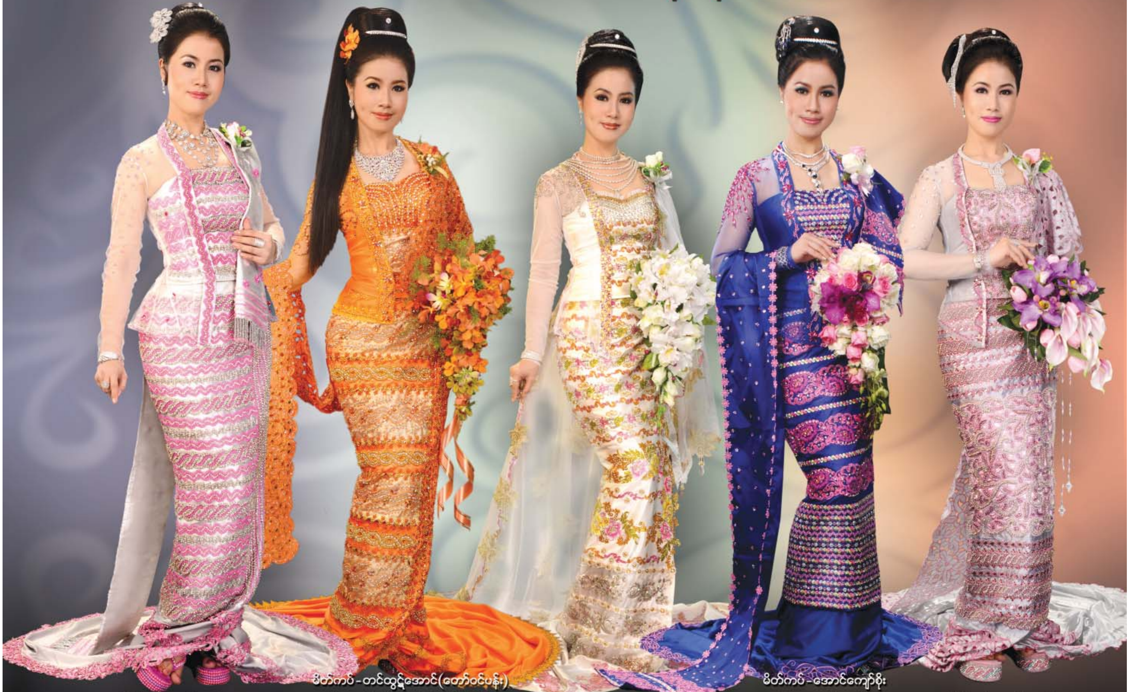
မိတ်ကပ် - ထက်ထက် ဝတ်စုံ - မျိုးမင်းစိုး လက်ဝတ်ရတနာ - ငွေထီးသုံးလက်