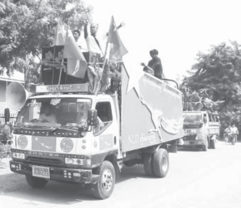
အောင်နိုင်ရေး အနုပညာရှင်၊ တေးသံရှင်များအဖွဲ့သည် အဆိုပါနေ့ ညနေပိုင်းတွင် မုံရွာမြို့မှတစ်ဆင့် ဘုတလင်မြို့သို့ သွားရောက်ကာ ဆက်လက် ဖျော်ဖြေ ကြမည်ဖြစ်ကြောင်းသိရသည်။