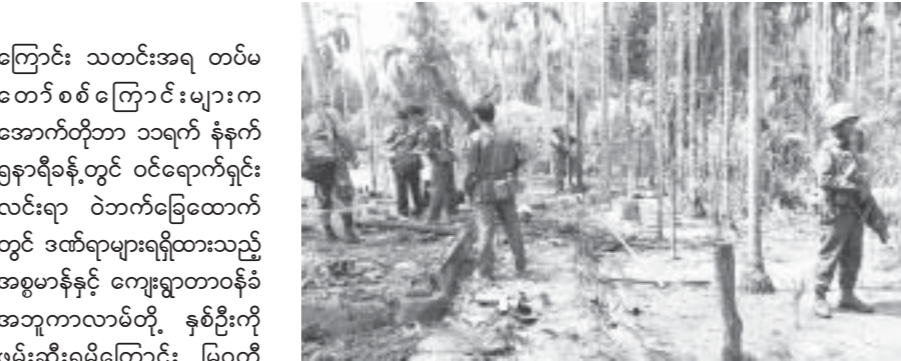
မောင်တောမြို့နယ်အတွင်း အကြမ်းဖက်စီးနင်းတိုက်ခိုက်မှု ဖြစ်စဉ်မြေပုံ

ကြောင်း သတင်းအရ တပ်မတော် စစ် ကြောင်း များက အောက်တိုဘာ ၁၀ရက် နံနက် ၅နာရီခန့်တွင် ဝင်ရောက်ရှင်းလင်းရာ အကြမ်းဖက်စီးနင်းတိုက်ခိုက်သူ ငါးဦးခန့်က လက်နက်ငယ်များ၊ စက်သေနတ်များဖြင့် တိုက်ခိုက်သဖြင့် တပ်မတော်စစ်ကြောင်းက ပြန်လည်ပစ်ခတ်တိုက်ခိုက်ခဲ့သည်။ ထိုသို့ အပြန်အလှန်ပစ်ခတ်နေစဉ် အကြမ်းဖက်စီးနင်းတိုက်ခိုက်သူ အင်အား ၃၀၀ခန့်က လက်နက်ငယ်များ၊ စားနှင့်တုတ်များကိုင်ဆောင်၍ တပ်မတော်စစ်ကြောင်း၏ မြောက်ဘက်နှင့် အနောက်ဘက်တို့မှ တိုက်ခိုက်လာသဖြင့် ပြန်လည်ပစ်ခတ်တိုက်ခိုက်ရာ ၎င်းတို့ဆုတ်ခွာထွက်ပြေးသွားသည်။ ထိုဖြစ်စဉ်တွင် အကြမ်းဖက်အလောင်းတစ်လောင်း၊ သေနတ်နှစ်လက်၊ ကျည်အိမ်နှစ်ခု သိမ်းဆည်းရမိသည်။