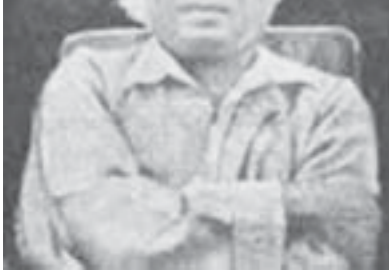
ငါ့အိမ်ထဲမှာ

အကျိုးမရှိတဲ့စာကို ရေးတာလိုဖြစ်နေတာပါပဲ။ ယောက်ျား။ ။ ရှေးပညာရှိကြီးများကို အတု ခိုးပြီး ရေးတာဟာ အကျိုးမရှိဘူးလား သူငယ်မရဲ့။ ညို ။ ။အတုခိုးရေးရင် အတုအပဖြစ်မှာ ပေါ့ရှင်။ သည်တော့ စာဖတ်တဲ့လူများက အတု အပကို မဖတ်ချင်ကြဘဲ ဦးပုညအစစ်ကို ဖတ်ချင်ကြပေလိမ့်မယ်။ တကယ်လို့ ကိုယ်ပိုင်ဉာဏ်ကိုသုံးပြီး နည်းသစ်နည်းဆန်း ထွင်နိုင်တယ်ဆိုရင် စာဖတ်သူများများ အကျိုးကျေးဇူးရှိမှာပဲ။