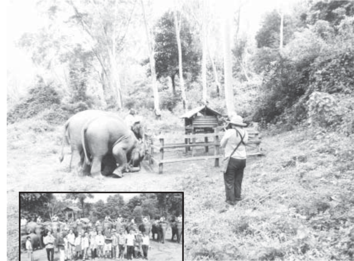
နတ်ပေါက်ဆင်စခန်းကို ဇူလိုင်လတွင် နှစ်ပေါက်ဆင်စခန်းကို ဝင်ရောက်ခဲ့ခြင်း

စစ်ကိုင်းတိုင်းဒေသကြီး ကသာမြို့ အနောက်သစ်တောခရိုင်နယ်မြေရှိ နတ်ပေါက်ဆင်စခန်းသို့ စက်တင်ဘာ ၁၀ရက်က နိုင်ငံခြားသားခရီးသွားဧည့်သည် ၅၁ဦး စတင်ဝင်ရောက်ခဲ့ပြီး ၁၁ရက်နေ့တွင် နိုင်ငံခြားသားခရီးသည် ၁၂ဦး ထပ်မံဝင်ရောက်ခဲ့ကြောင်း သိရသည်။