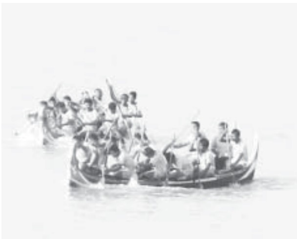
မန္တလေးမြို့၊ မန္တလေးမြို့နယ်၊ ဝဏ္ဏမာရ်ဇာတိပုံ