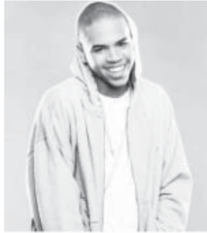
ရသည်။ သူ၏အပြုအမူသည် အားလုံးအတွက် ဝေဖန်စရာ ဖြစ်ခဲ့သည်။

ထိုအခါ ရုပ်ရှင်မင်းသားအဆိုတော်သည် အမေရိကန်တွင် ရဲများက အသားအရောင်ခွဲခြားကာ ဖိနှိပ်မှုများကို ဆန့်ကျင်သည့်အနေဖြင့် NFL ပလေယာကောလင်းကေးပါနစ်စတွင်ချိန်တွင် ငြိမ်သက်စွာနေခဲ့သည်။ 'တန်' က အကြမ်းဖက်တိုက်ခိုက်မှုကြောင့် သေဆုံးခဲ့ရသော လူ ၃၀၀၀ကျော်အတွက် ရပ်တည်ပြီး ဂုဏ်ပြုပေးကြရန် တိုက်တွန်းပြောကြားနေချိန်တွင် ခရစ်ဘာရောင်းသည် သူ၏ သူငယ်ချင်းများနှင့်အတူ ထိုင်နေသည်ကို တွေ့ခဲ့