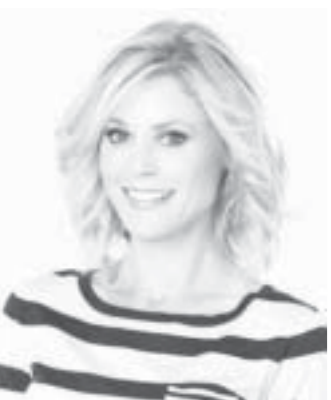
Modern Family ၏ ဒုတိယ စတာဂျူလီယိုဝင်းက ဒေါ်လာ ၁၂ သန်း