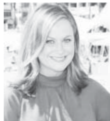
Law and Order: SUV ၏ မင်းသမီး ဖာရစ်ကာဟာဂျီတေးက ဒေါ်လာ ၁၁ သန်း