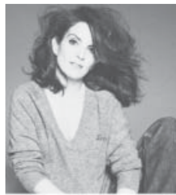
Unbreakable Kimmy Schmidt ၏ မင်းသမီးတီနာဖေးနှင့် Bones ၏ မင်းသမီးအီပိုင်ဒက်ချေနယ် တို့က ဒေါ်လာ ၆.၅ သန်း