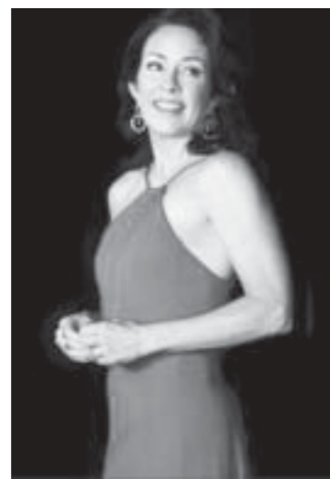
Scandal ၏ မင်းသမီး ကယ်ရီ ဝါရှင်တန်နှင့် The Middle ၏ မင်းသမီး ဟက်ရီဂျာဟီတန်တို့က ဒေါ်လာခုနစ်သန်း