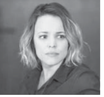
Doctor Strange ဇာတ်ကားသည် ၂၀၁၆ ခုနှစ် နိုဝင်ဘာလတွင် ထွက်ရှိမည်ဖြစ်သည်။

ရေချယ်အမ်စီအက်ဒမ်သည် မာဗယ်ရုပ်ရှင် ထုတ်လုပ်ရေးကုမ္ပဏီတော့မည့် စူပါဟီးရိုဇာတ် လမ်းညွှဲ Doctor Strange တွင် ပါဝင်သရုပ်ဆောင် ရန် ဘီနီဒစ်ကန်ဗာဘက်ကို ဆက်သွယ်ခဲ့သည်။ The Notebook ဇာတ်ကား၏ မင်းသမီး ရေချယ်အမ်စီအက်ဒမ်ကို Doctor Strange ဇာတ် ကားတွင်ပါဝင် သရုပ်ဆောင်ရန်မကြာသေးခင် ကမှ ရွေးချယ်ခဲ့သည်။ ဘီနီဒစ်ကန်ဗာဘက်သည် မှော်ဆရာတစ်ဦးအဖြစ် ပါဝင်သရုပ်ဆောင်ထား သည်။ ရေချယ်အမ်စီအက်ဒမ်က စထရီနိုး၏ အကြံပေးနေရာနှင့် လူယုတ်မာနေရာတို့တွင် မည် သည့်နေရာမှ ပါဝင်သရုပ်ဆောင်မည်ကို မသိရ သေးပေ။