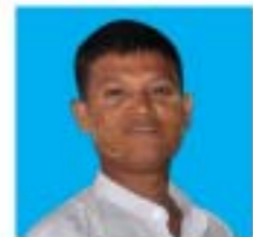
ကိုအေးကို ၇/ပစန(နိုင်)၂၉၆၆၀၀ ပဲခူးမြို့