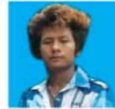
ကိုပိုင်ပိုင်ချစ်မောင် ၅/စကန(နိုင်)လ၁၁၇၅၇၁ စစ်ကိုင်းမြို့