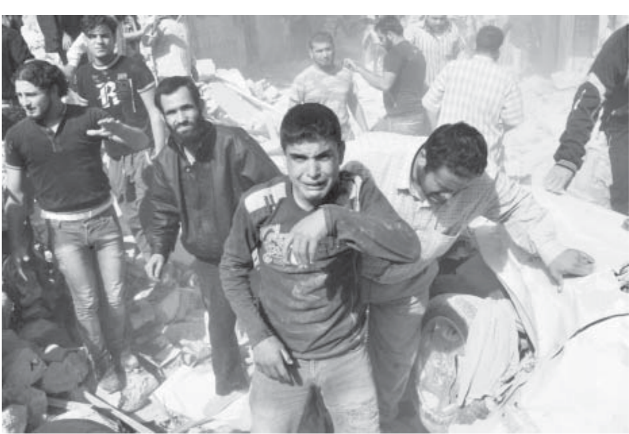
ကမ္ဘာ့အင်အားကြီးနိုင်ငံများက ဂျာမနီနိုင်ငံတွင် ဆွေးနွေးပြီး

နောက် သီးရီးယားနိုင်ငံတွင်ဖြစ်ပွားနေသည့် တိုက်ပွဲများရပ်တန့်ရန် တပ်ပတ်အတွင်း ဆွေးနွေးမှုများပြုလုပ်ဖို့ သဘောတူလိုက်သည်ဟု ဖေဖော်ဝါရီ ၁၂ရက် ဘီဘီစီသတင်းမှာ ဖော်ပြသည်။