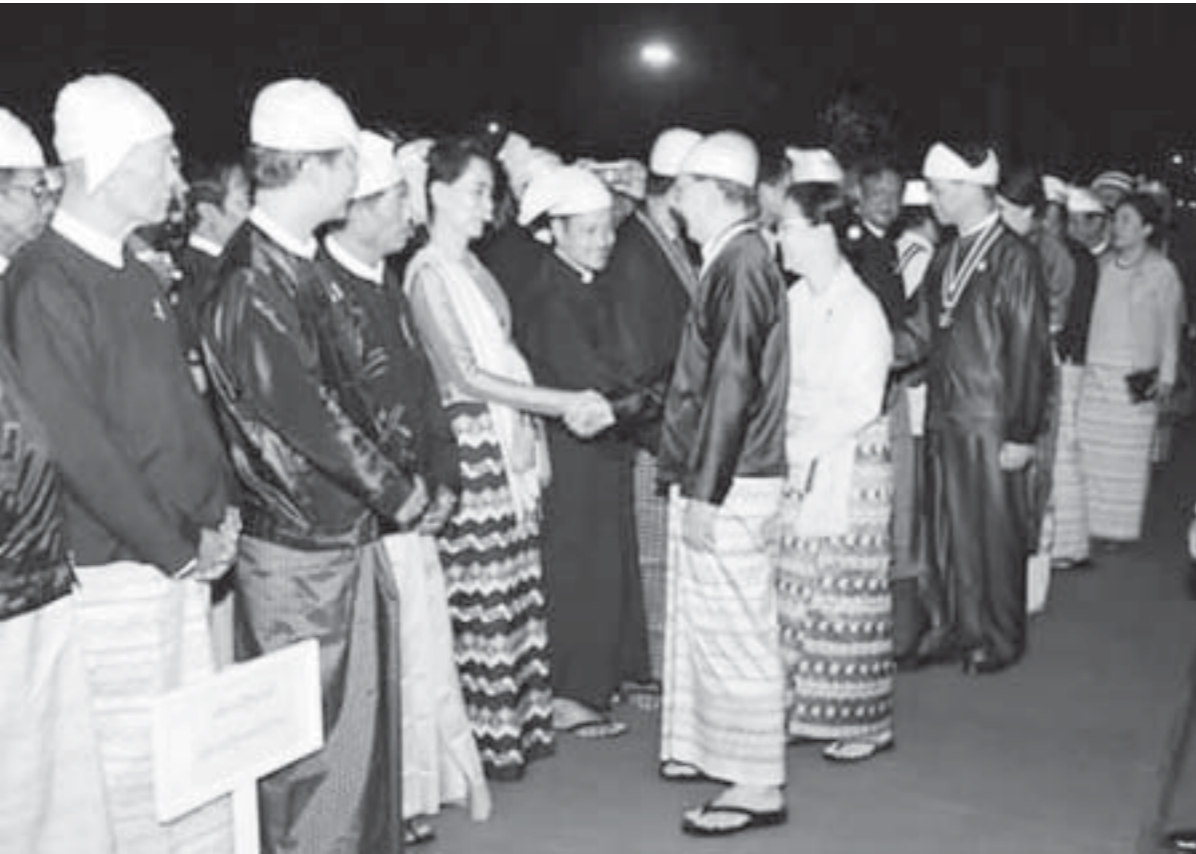
ဖိုးညှဏ်နှင့် ဖိုးမြိုင် ဆွေးနွေးခန်း