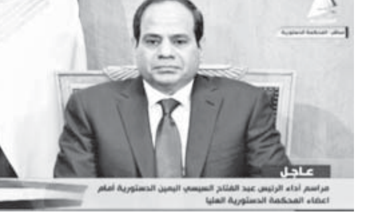
ပြည်သူ့အနည်းငယ်ကတော့ ကိုင်ရိုရှိ အခြေခံဥပဒေခုံရုံးအပြင်ဘက်မှာ လွန်ခဲ့သည့်နှစ်နှစ်က မော်စီမှ သမ္မတအဖြစ် ကျမ်းသစ္စာကျိန်ဆိုခဲ့သည့်နေရာတွင်စုရုံးပြီး စီစီနိုင်ငံရေး သမားများ တက်ရောက်ခဲ့သည်။

စစ်တပ်အကြီးအကဲဟောင်း ဗိုလ်ချုပ်ကြီးစီစီက အတိုက်အခံများကိုဖြိုဖျက်ပြီး လေးနှစ် သမ္မတသက်တမ်း တာဝန်ထမ်းဆောင်ရန် ဇွန်လ ၈ရက်နံနက်က ကျမ်းသစ္စာကျိန်ဆိုခဲ့ သည့် အခမ်းအနားသို့ အနောက်နိုင်ငံများမှ ခေါင်းဆောင်အနည်းငယ်မျှသာ တက်ရောက်ခဲ့သည်။ ယခင်စစ်တပ်အကြီးအကဲဟောင်း အက်ဒယ်ဖာတာအယ်စီတီသည် သမ္မတဟောင်းမော်စီကို ဖြုတ်ချပြီး တစ်နှစ်အကြာမှာ ၂၀၁၁ခုနှစ်နောက်ပိုင်း အီဂျစ်၏ ပဉ္စမမြောက်နိုင်ငံအကြီးအကဲအဖြစ် တရားဝင်ကျမ်းသစ္စာကျိန်ဆိုခဲ့ခြင်းဖြစ်သည်။