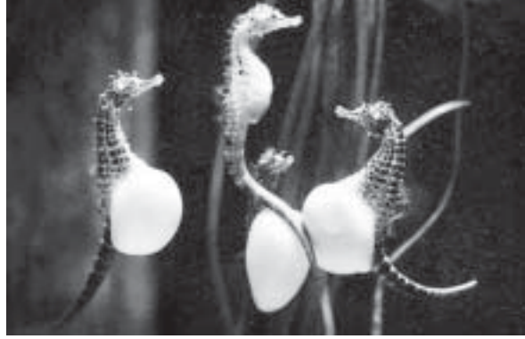
ကိုယ်ဝန်ဆောင်ဆီနီဒါ