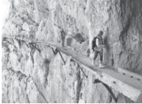
တောင်ပတ်လမ်း