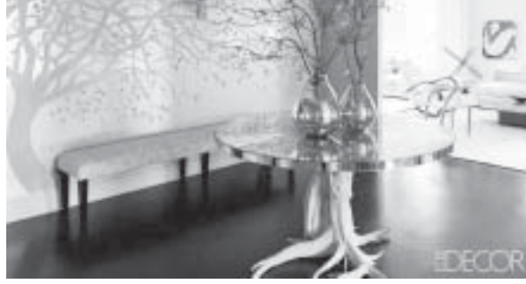
အနုပညာဌာန