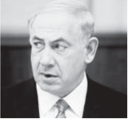
ပရိဘောဂပစ္စည်းများကို ကိုယ်ပိုင်အိမ်သို့ ပြောင်းရွှေ့ထားခြင်းမှာ မဟုတ်ကြောင်းငြင်းဆိုထားသည်။

အစ္စရေးဝန်ကြီးချုပ် နေတန်ယာဟုသည် ၎င်း၏ကိုယ်ပိုင်နေအိမ်အတွက် ပရိဘောဂပစ္စည်းများဝယ်ရန် ပြည်သူ့ဘဏ္ဍာငွေကို လွန်လွန်ကြူးကြူးသုံးစွဲခဲ့သည်ဟု စွပ်စွဲခံနေရသည်။၎င်းသည် ပုဂ္ဂလိကနေအိမ်မှာအသုံးပြုမည့် ပရိဘောဂများအတွက် ပြည်သူ့ငွေ ပေါင် ၅၁၀၀ ခန့် သုံးစွဲခဲ့သည်ဟု စွပ်စွဲခံထားရသည်။ နိုင်ငံရေးအတိုက်အခံတစ်ဦးက အစ္စရေးခေါင်းဆောင်သည် ဂျေရုဆလင်ရှိ အစိုးရ နေအိမ်မှာသုံးဖို့ဆိုပြီး ပရိဘောဂများဝယ်ပြီးနောက် ဂေကဆာရီးယားရှိ ပင်လယ်ကမ်းစပ်အနီးမှာ သူပိုင်ဆိုင်သည့် နေအိမ်သို့ပြောင်းရွှေ့သွားခဲ့သည်ဟုဆိုသည်။ မစ္စတာနေတန်ယာဟု ရုံးအဖွဲ့ကမူ