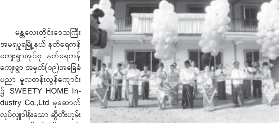
အထက်တန်းကျောင်းမှ ဘာသာစုံဂုဏ်ထူးရှင်ညီမလေးများအား အထူးထူးခြားခြားစေလှူပေးခဲ့ခြင်း

ဆောင်သစ်ဖွင့်ပွဲနှင့် လွှဲပြောင်းပေးအပ်ပွဲကို ဇွန် ၁၂ရက် နံနက် ၇နာရီက အဆိုပါကျောင်း၌ ကျင်းပသည်။