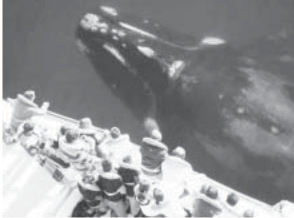
ရေအောက်ကြည့်သင်္ဘောနှင့် ဝေလငါး