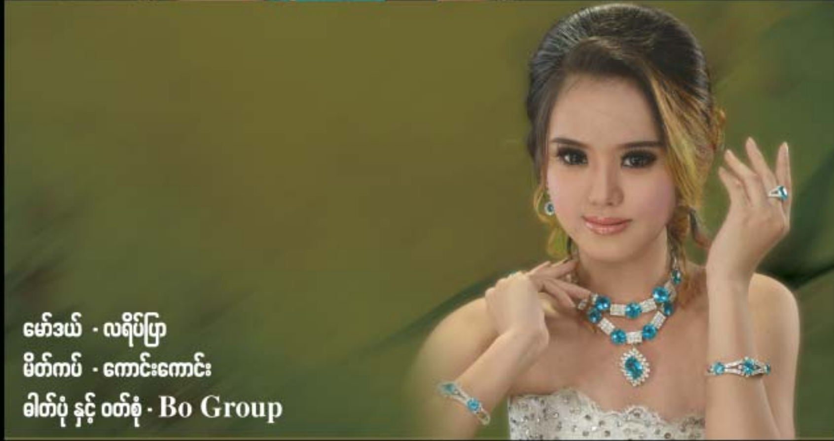
မော်ဒယ် - လရိပ်ပြာ မိတ်ကပ် - ကောင်းကောင်း ဓါတ်ပုံ နှင့် ဝတ်စုံ - Bo Group