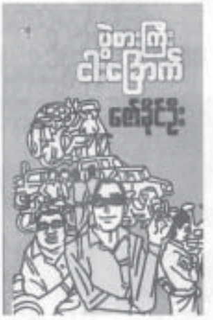
ထန်းစိုး - ၃၀၀၀ ကျပ်

လင်းလွန်းခင်စာပေမှ ဝေခံနိုင်ဦး၏ ပွဲစားကြီး ငါးခြောက်စာအုပ်ကို ပထမအကြိမ် ထုတ်ဝေဖြန့်ချိသည်။ မန္တလေးတက္ကသိုလ်မှ ဘဝတက္ကသိုလ်သို့ ခရီးဆက်ခဲ့သူ၊ မီးဘေးသင့်ပြီး ဂုဏ်ထူးတန်းမှပထမရရှိပြီး ဝေခံနိုင်ဦး အစောင့်အဝယ်လည်းမကောင်းတော့သည့် နောက်ကားလောကနှင့် ဆိုင်ကယ်လောကထဲသို့ ဝေခံနိုင်ဦးအစောင့်အဝယ်လည်းမကောင်းတော့သည့် နောက်ကားလောကနှင့် ဆိုင်ကယ်လောကထဲသို့ ပွဲစား ငါးခြောက်စာအုပ်ကို ပထမအကြိမ် ထုတ်ဝေဖြန့်ချိသည်။ ထိုစဉ်က ပွဲစားကြီး ငါးခြောက်စာအုပ်ကို ပထမအကြိမ် ထုတ်ဝေဖြန့်ချိသည်။ ထိုစဉ်က ပွဲစားကြီး ငါးခြောက်စာအုပ်ကို ပထမအကြိမ် ထုတ်ဝေဖြန့်ချိသည်။