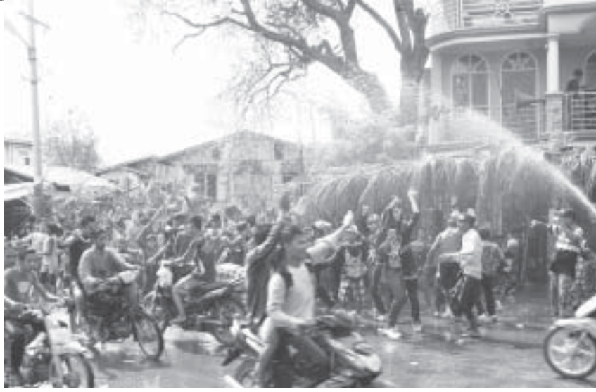
ဆိုင်ကယ်တွေနဲ့လည်း ဖျော်ကြတယ်

၁၃၇၅ ခုနှစ် မန္တလေးမြို့တော် မြန်မာ့ရိုးရာယဉ်ကျေးမှု မဟာသင်္ကြန်ပွဲတော်