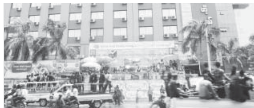
ဂရိတ်ဝေါလ်ဟိုတယ် ရေကစားမဏ္ဍပ်