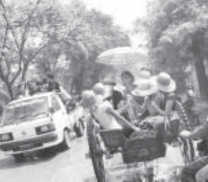
မြင်းလှည်းနဲ့လည်း လည်ကြတယ်