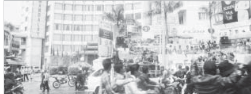
Hotel Mandalay ရေကစား မဏ္ဍပ်