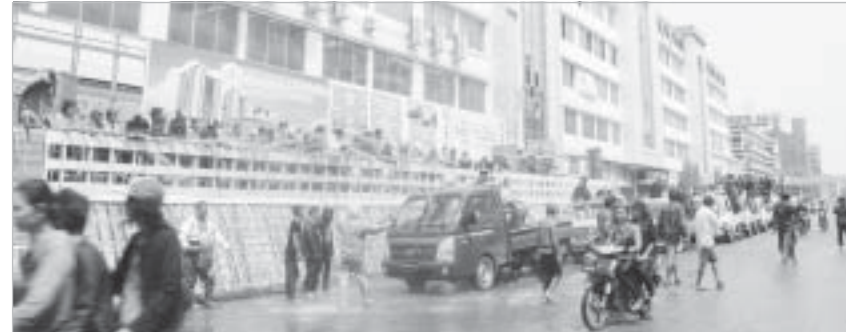
မန်းမြန်မာ ပလာစတစ်