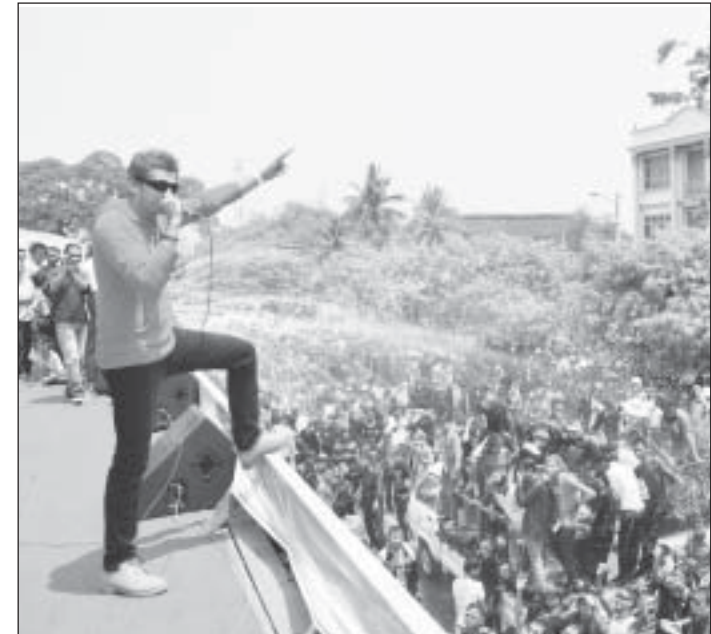
အားပါးတရ သီဆိုဖျော်ဖြေနေကြတဲ့ အနုပညာရှင်များ