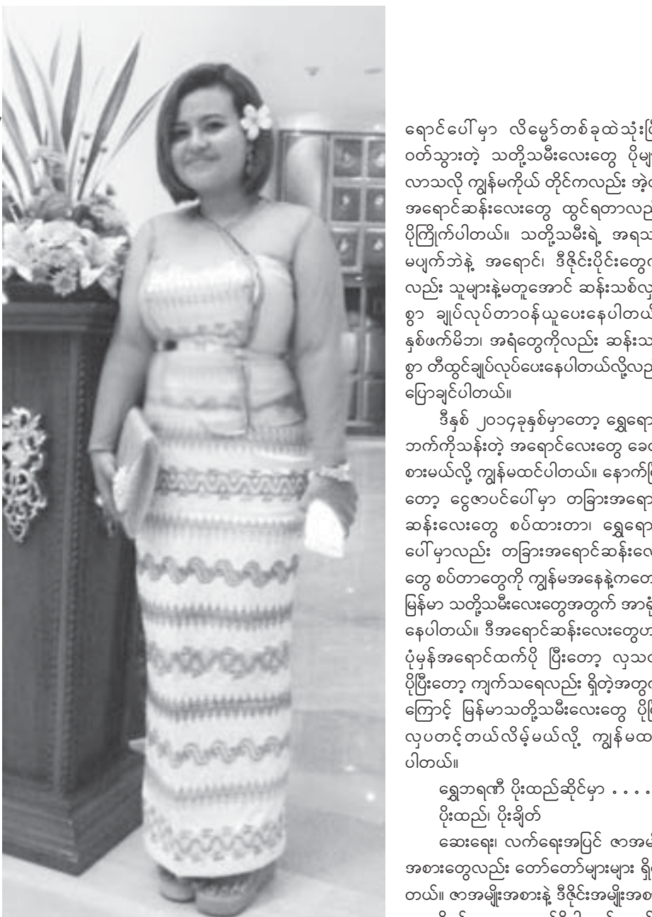
ရောင်ပေါ်မှာ လိမ္မော်တစ်ခုထဲသုံးပြီး ဝတ်သွားတဲ့ သတို့သမီးလေးတွေ ပိုများလာသလို ကျွန်မတို့က တိုင်ကလည်း အံ့လိုအရောင်ဆန်းလေးတွေ ထွင်ရတာလည်း ပိုကြိုက်ပါတယ်။ သတို့သမီးရဲ့ အရသာမပျက်ဘဲနဲ့ အရောင်၊ ဒီဇိုင်းပိုင်းတွေကိုလည်း သူများနဲ့မတူအောင် ဆန်းသစ်လှပစွာ ချုပ်လုပ်တာဝန်ယူပေးနေပါတယ်။ နှစ်ဖက်မိဘ၊ အရံတွေကိုလည်း ဆန်းသစ်စွာ တီထွင်ချုပ်လုပ်ပေးနေပါတယ်လို့လည်း ပြောဆိုခဲ့ပါတယ်။

အလှူဒါန်းပွဲကို နံနက်၇နာရီခွဲမှ မွန်းလွဲ ၁၂နာရီခွဲအထိ လက်ခံဆောင်ရွက်ပေးရာ စေတနာရှင်သွေးလျှာရှင်များလာရောက်လှူဒါန်းခဲ့ကြသည်။ ၂၀၁၄ခုနှစ် မြန်မာနှစ်ဆန်းတစ်ရက်နေ့တွင် စေတနာရှင်သွေးလျှာရှင်များမှ လှူဒါန်းသော သွေးအမျိုးအစားအမျိုးမျိုး ၂၇၄အိတ်လက်ခံရရှိခဲ့ကြောင်း၊ ၂၀၁၄ခုနှစ် ဇန်နဝါရီလမှ မတ်လအထိ ဇီဝိတဒါနစေတနာရှင်များ၏သွေးလှူဒါန်းမှုအနေဖြင့် သွေးအိတ်ပေါင်း ၉၀၅၅အိတ်ရှိပြီဖြစ်ကြောင်း အမျိုးသားသွေးလျှာဘဏ်မှ သိရသည်။