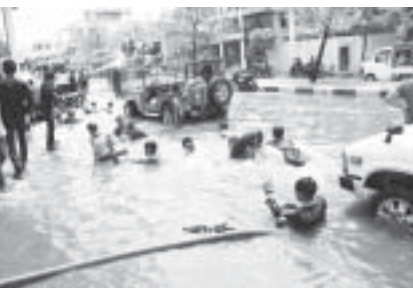
ကျီးဘေးမှာ ရေကူးကြတယ်