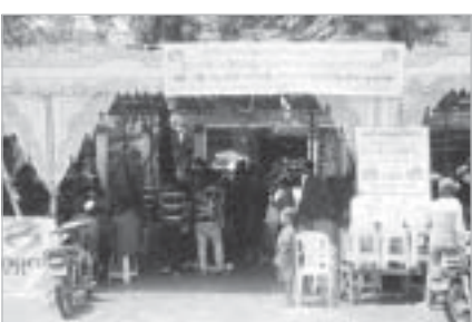
စတုဒိသာမဏ္ဍပ်တစ်ခု