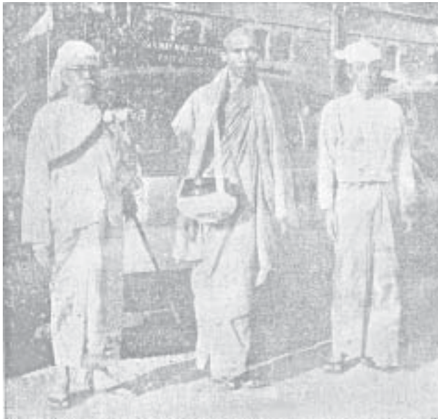
ချင်းတောင်သာသနာပြုဆရာတော်နှင့်အတူ ဆာဦးသွင်နှင့် ဆရာဦးဘချို

တ ၇ ၁ ခးလွတ် ၆ တ ၁ ၆ ၇ ၆ န တ ၈ ၂ ဦး(မန္တလေး)