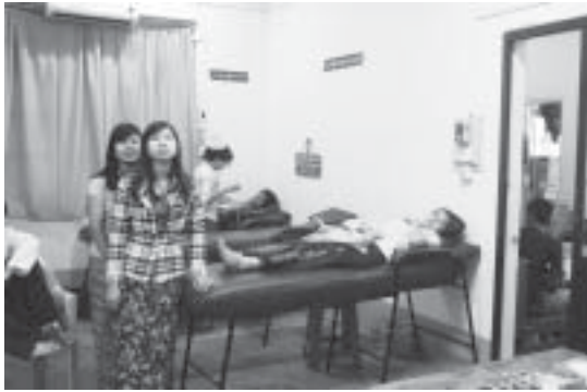
လှူဒါန်းမှုကို နံနက်၇နာရီခွဲမှ မွန်းလွဲ ၁၂နာရီခွဲအထိ လက်ခံဆောင်ရွက်ပေးရာ စေတနာရှင်သွေးလျှာရှင်များလာရောက်လှူဒါန်းခဲ့ကြသည်။ ၂၀၁၄ခုနှစ် မြန်မာနှစ်ဆန်းတစ်ရက်နေ့တွင် စေတနာရှင်သွေးလျှာရှင်များမှ လှူဒါန်းသော သွေးအမျိုးအစားအမျိုးမျိုး ၂၇၄အိတ်လက်ခံရရှိခဲ့ကြောင်း၊ ၂၀၁၄ခုနှစ် ဇန်နဝါရီလမှ မတ်လအထိ ဇီဝိတဒါနစေတနာရှင်များ၏သွေးလှူဒါန်းမှုအနေဖြင့် သွေးအိတ်ပေါင်း ၉၀၅၅အိတ်ရှိပြီဖြစ်ကြောင်း အမျိုးသားသွေးလျှာဘဏ်မှ သိရသည်။

သွေးလျှာဘဏ်၌တစ်နှစ်အတွင်း လှူဒါန်းမှုတွင် မြို့ပေါ်နှင့် အနယ်နယ်အရပ်ရပ်မှ ပရဟိတလူမှုရေးအသင်းအဖွဲ့ များ၊ ကုမ္ပဏီများမှ စေတနာရှင်သွေးလျှာရှင်များ၊ တက္ကသိုလ် ကောလိပ်အသီးသီးမှ ကျောင်းသားကျောင်းသူများ၊ တစ်သီးပုဂ္ဂလအလှူရှင်များ၊ ရဟန်းသံဃာများပါဝင်ပြီး သွေးအုပ်စု အမျိုးအစားအလိုက် အေ စင်ခရေအိတ်၊ ဘီ ၁၀၂၅၅အိတ်၊ အို ၁၁၃၈၂ အိတ်၊ အေဘီ ၂၈၀၈ အိတ်ရရှိခဲ့ကြောင်းသိရသည်။ မန္တလေးဆေးရုံကြီးရှိ အမျိုးသားသွေးလျှာဘဏ်၌ မဟာသင်္ကြန်ပွဲတော်ရက်များတွင်လည်း အရေးပေါ်သီးခြားလှူဒါန်းမှုများကိုလည်း လက်ခံဆောင်ရွက်ပေးခဲ့ကြောင်း သိရသည်။ အမျိုးသားသွေးလျှာဘဏ်အနေဖြင့် မြန်မာ့နှစ်သစ်ကူးကာလ နှစ်ဆန်းတစ်ရက်နေ့တွင်လည်း စေတနာရှင်များ၏ သွေး