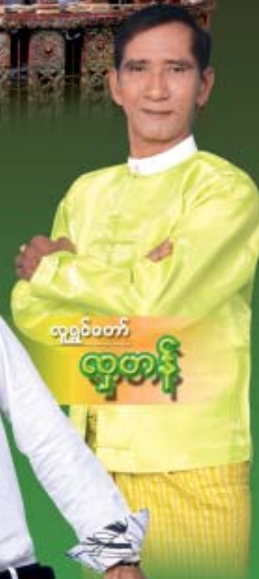
လူရွှင်တော် ဓမ္မစာနီ