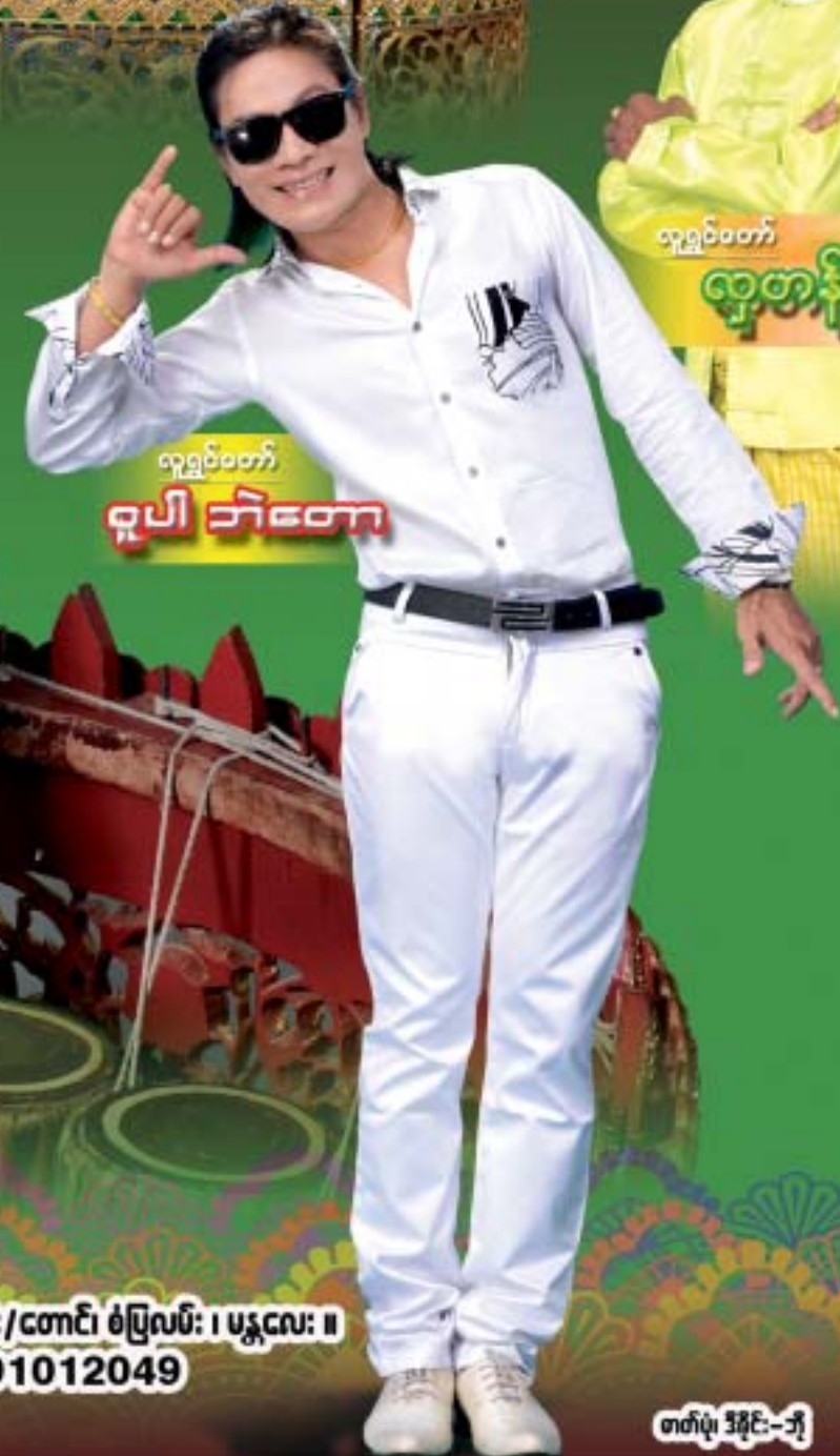
လူရွှင်တော် ဂျပါ ဘီတော