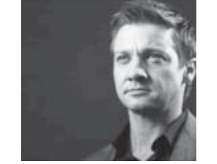
အသက် ၄၅နှစ်အရွယ်ရှိ အဆိုပါမင်းသားက