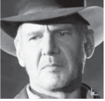
The Advenger စတားမင်းသားဂျီရိုမိုရ်းနားသည် Mission Impossible ဇာတ်လမ်းတွဲတွင် ပြန်လည်၍ သရုပ်ဆောင်တော့မည်ဖြစ်သည်။ သူ သည် ထိုဇာတ်လမ်းတွဲတွင် စိလီယံဘရမ်းအဖြစ် သရုပ်ဆောင်မည်။ သူသည် အခြားဇာတ်ကား ဝါးကားတွင်လည်း သရုပ်ဆောင်ရန် သဘောတူ ထားပြီး ဖြစ်သည်။