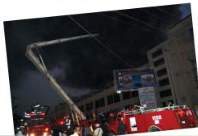
သတင်း နှင့် စာတိုပုံ - မျိုးကျော်ကျော် -

မန္တလေး ချမ်းအေးသာစံမြို့နယ်၊ ၇၂x၇၃ လမ်းကြားနှင့် လမ်း၃၀x၃၀လမ်းကြားရှိ အဆင့်မြင့် မဂ်လာဈေးတွင် မတ် ၂၂ရက် ညနေ ၅နာရီ ၅၅မိနစ်ခန့်တွင် မီးလောင်ကျွမ်းမှုဖြစ်ပွားခဲ့သည်။ အဆိုပါမီးလောင်မှုမှာ ဈေးအနောက် တောင်ထောင့် မြေညီထပ်(ယ)ပုံမှ မီးစတင်လောင်ကျွမ်းခဲ့ခြင်းဖြစ်ကြောင်း မန္တလေးတိုင်းဒေသကြီး ပြန်/ဆက်က သတင်းထုတ်ပြန်သည်။ မတ် ၂၃ရက် ထုတ် နိုင်ငံခြားသတင်းစာတွင် ကနဦးသတင်းများအရ မဂ်လာဈေးပိတ်သိမ်းချိန်ဈေးခ တောင်တက်အခြား အပေါ်ထပ်ပုံစံတောင်လောင်ကျွမ်းမှုဖြစ်ပွားကြောင်း ဖော်ပြခဲ့သည်။ မီးလောင်ကျွမ်းမှုအား Level ၆ အဆင့်သတ်မှတ်ခဲ့ပြီး မန္တလေးခရိုင်အတွင်းရှိ မီးသတ်ယာဉ်များနှင့် မီးသတ်တပ်ဖွဲ့များ ပိုင်းစုပြီးမီးသတ်ခဲ့ကြသည်။ မန္တလေးမြို့ပေါ်ရှိ မီးသတ်ယာဉ်အစီး ၁၂စီးနှင့် သေစွမ်းသတ်တပ်ဖွဲ့ဝင် ၁၄၀၊ အရန်မီးသတ်တပ်ဖွဲ့ဝင် ၁၈၀၊ နယ်မြေတပ်မှ အင်အား ၃၀၀ ခန့်၊ ရဲတပ်ဖွဲ့ဝင်အင်အား ၂၅၀ခန့်နှင့် လူမှုဝန်ထမ်း အသင်းအဖွဲ့ဝင်များပါဝင်ပြီးမီးသတ်ခဲ့ကြသည်။ ကျောက်ဆည်၊ စဉ့်ကိုင်၊ တံတားဦးမြို့နယ်များမှ မီးသတ်ယာဉ်များလည်း လာရောက်ငြိမ်းသတ်ခဲ့သည်။ မီးလောင်ရာသို့ မန္တလေးတိုင်းဒေသကြီး ဝန်ကြီးချုပ်နှင့်အဖွဲ့ လာရောက်ကြည့်ရှုခဲ့ပြီး တပ်မတော်သားများနှင့် ရဲတပ်ဖွဲ့ဝင်များကလည်း လုံခြုံရေးရယူပေးခဲ့သည်။ မီးစတင်လောင်ကျွမ်းချိန်မှာ ဈေးပိတ်ချိန် ဖြစ်သဖြင့် မြောက်ဘက်ဈေးတံခါးအား ချိမ်းပျက်စင်ရောက်ကာ မီးငြိမ်းသတ်မှုစတင်ပြုလုပ်ခဲ့ရကြောင်းသိရသည်။ ဈေးအတွင်းရှိ ဆိုင်ခန်းပိုင်ရှင်