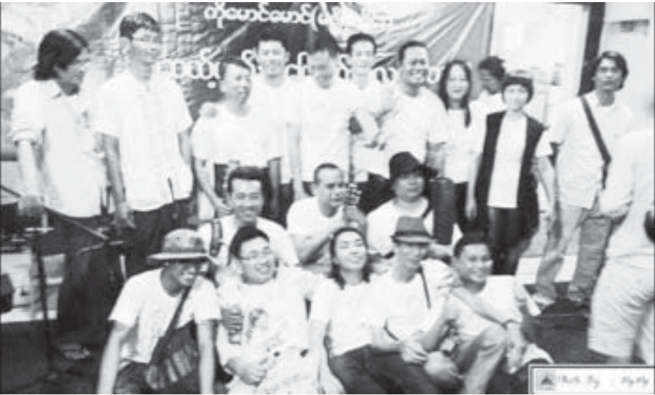
ကိုမောင်မောင်(မရွှိမလှိုင်း)၏ အောင်မြင်ကျော်ကြားခဲ့သော သီချင်းများကို သီဆိုဖျော်ဖြေခဲ့ကြသည့်အဖွဲ့အစည်းများကို နှစ်စဉ်အသင်းအဖွဲ့အစည်းဖွဲ့စည်းပေးခဲ့ခြင်းဖြစ်သည်။

ကြွက်နီ၊ ဝက်ပု၊ ငကြောင်၊ ခြောက်လုံး၊ ပြာတိုး၊ ချောက်စောင်း၊ လေးလုံးဆိုတဲ့ နာမည်ပြောင်တွေကနေလည်း အတည်ဖြစ်သွားတတ်ပါတယ်။ နာမည်ရင်းထက် နာမည်ပြောင်က အသားစီးရသွားတဲ့အဖြစ်တွေ အများကြီးရှိတတ်ပါတယ်။