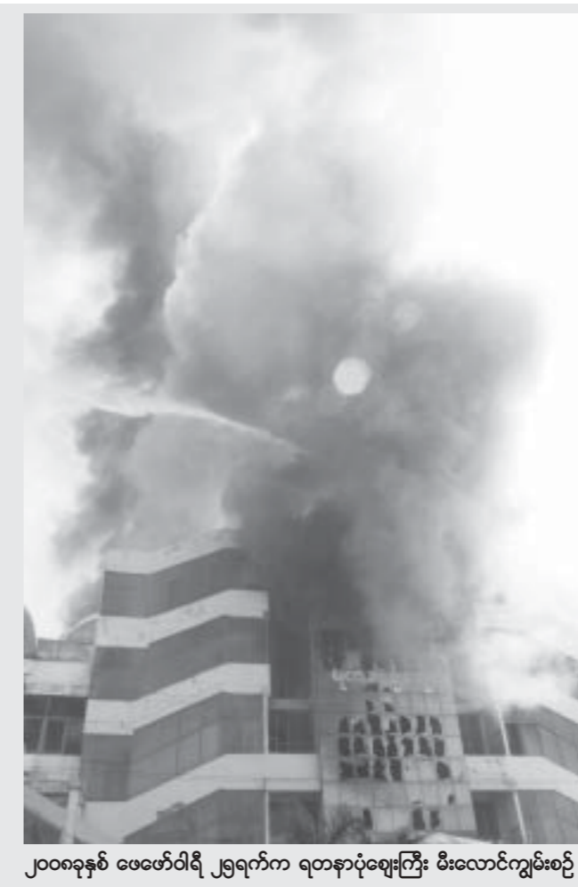
၂၀၀၈ခုနှစ် ဖေဖော်ဝါရီ ၂၅ရက်က ရတနာပုံဈေးကြီး မီးလောင်ကျွမ်းစဉ်