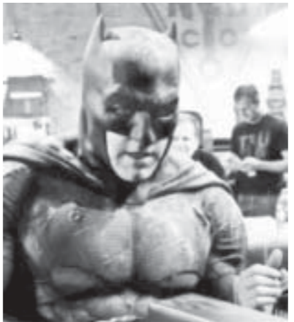
The Veteran (စစ်ပြန်ကြီး)ဇာတ်ကားတွင် သရုပ်ဆောင်ကောင်းတစ်ဦးအဖြစ် သတ်မှတ် မြင်းခံရသော ဟာရစ်ဆင်ရိုဒ်သည် Indiana Jones