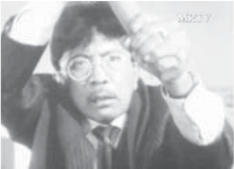
မိန်းမရုပ်ရှင်ကားမှာ မိန်းမရုပ်ရှင်ကားမှာ မိန်းမရုပ်ရှင်ကားမှာ

မြန်မာ့ရုပ်ရှင်ရဲ့ လာရာလမ်းကြောင်းဟာ ခပ်ညှပ်ညှပ်မဟုတ်ပါဘူး။ အနုပညာဇာတ်ခံကောင်းတဲ့ ပုဂ္ဂိုလ်တွေ၊ အမြော်အမြင်ရှိတဲ့ မြန်မာသူတွေကြီးတွေက စတင်ဖော်ဆောင် မျိုးစေ့ချပေးခဲ့တာပါ။ မြန်မာ့ရုပ်ရှင်ငွေရတု ရွှေရတုတိုင်ဂုဏ်ယူဖွယ် မြန်မာ့ရုပ်ရှင်ကားကောင်းတွေ အများကြီးပေါ်ထွန်းခဲ့ပါတယ်။ အဲဒီထဲမှာ မည်သည့်နိုင်ငံခြား ရုပ်ရှင်ကား၊ နိုင်ငံခြားဝတ္ထုကိုမျှမမှီးယူဘဲ မြန်မာဇာတ်လမ်း စစ်စစ်ကို ရိုက်ကူးထုတ်လုပ်ခဲ့တာမျိုး ရှိသလို နိုင်ငံခြားဝတ္ထု ရုပ်ရှင်ကို ပိုမြမ်းလို့ ပိုမြမ်းထားမှန်းမသိအောင် မြန်မာဇာတ်အဖြစ် ဖန်တီးထားနိုင်တဲ့ ရုပ်ရှင်ကားတွေလည်း ရှိပါတယ်။