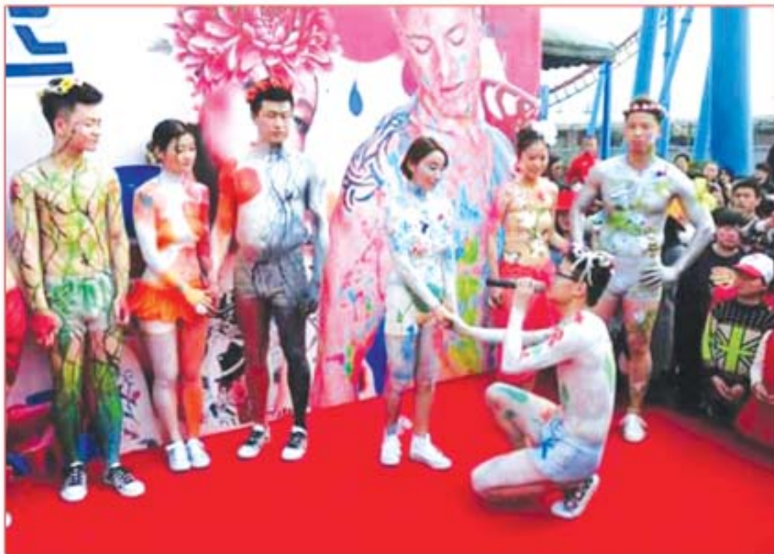
နွယ်စိုး၊ ဖရိုနီ၊ ဘာသာပြန်ဆိုသည်

တစ်နှစ်ခွဲခန့်ကတည်းက ဟိုကဲ့သို့သော လက်ထပ်ပွဲလုပ်ခဲ့သည်မှာ ကြာပြီဟုဆိုပါသည်။ အစပထမတွင် ဟိုသို့သော လက်ထပ်ပွဲဖို့ကို သတိထားနှင့် သတိသမီးနှစ်ဦးကလည်း ကားအတွင်း၌သော် လည်း ကောင်း။ အိမ်အတွင်း၌သော်လည်းကောင်း ပြုလုပ်ခဲ့ကြသည်။ သို့သော် ယခုကဲ့သို့သောကားတော့ ပရိသတ်ရှေ့မှာ လက်ထပ်ခဲ့ကြ သည်။ ဟန်ကျန်းမြို့မှာ ပြုလုပ်ခဲ့တာပါ။ စုံတွဲဆယ်တွဲ၏ အတွင်းအားလုံးသည် အတွင်းခံများသာ ဝတ်ဆင်ထားပြီး ခန္ဓာကိုယ်တစ်ခုလုံး ဆေးခြယ်ထားကြသည်။ ထိုလက်ထပ်ပွဲကို ကျင်းကျင်းကိုယ်ပိုင်အုပ်ချုပ်ခွင့်ရဒေသပို့ ဟန်ကျန်း မြို့ပန်းခြံအတွင်း၌ ပြုလုပ်ခဲ့သည်။ သူတို့ချစ်သူစုံတွဲများတွင် ရှေ့ကြေးအဆင်မပြေသူများလည်း ချစ်ခွင့်၊ လက်ထပ်ခွင့်ရှိနေကြောင်း၊ အဓိကကချစ်နေရန်သာ မြစ် ကြောင်း၊ ချစ်ရန်၊ လက်ထပ်ရန်စိုးရိမ်သူများကို နောက်ဆုတ် မသွားရန် ရည်ရွယ်ကြောင်း ပြောခဲ့သည်။