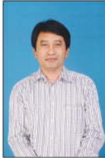
စကားပုဂံအောင်

အစနောက်ကျလျှင် အဆုံးလည်း နောက်ကျသည်။ ရုလင်ကောင်းများလည်း လျော့ပါးသည်။ ကျန်းမာသန်စွမ်း၊ သွက်လက် ချက်ချာသော လွယ်များဖြစ်ရန် "စောစောအိပ်စက်ခြင်း" အလေ့အကျင့်ပြုကြပါ။