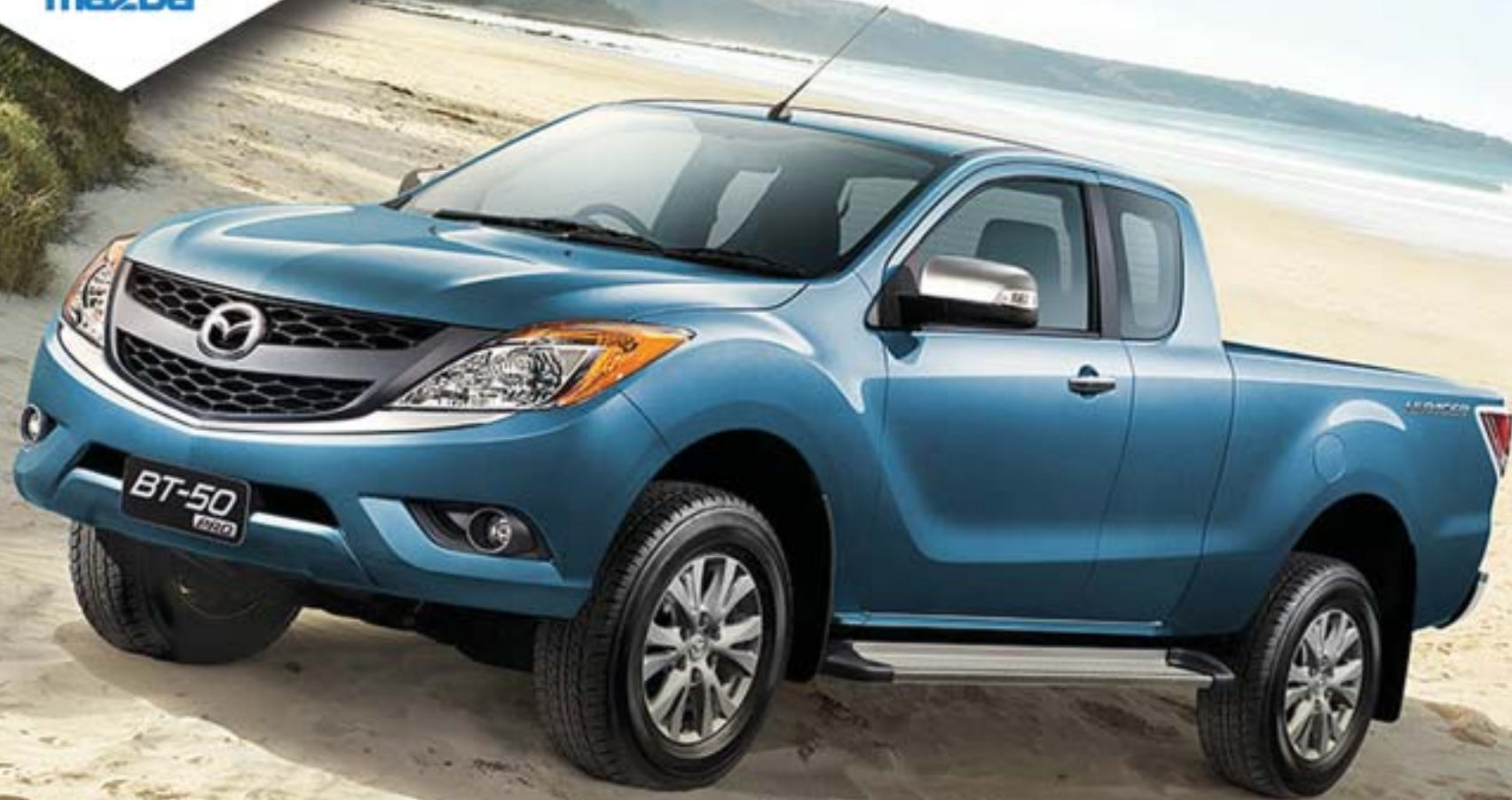
BT-50 EXTRA CAB

ALL NEW 4X4 BT-50 EXTRA CAB FROM 269 Lakhs only for the 1 st 16 units