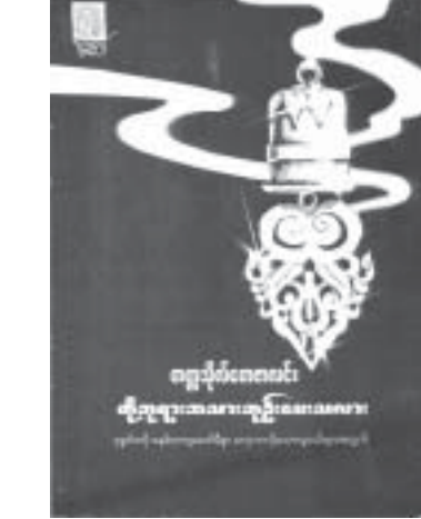
တန်ဖိုး - ၁၀၀၀ ကျပ်

မဗ္ဗကထိက ကျမ်းပြုဆရာတော်အရှင်တေဓနိယ (တက္ကသိုလ်တေဇာလင်း) ၏ ၃၇အုပ်မြောက် တို့ဘုရားအသားဘုဉ်းပေးသလား မဗ္ဗရသ စာစုများကို စုပေါင်းထုတ်ဝေသော စာအုပ်တစ်အုပ်ဖြစ်သည်။