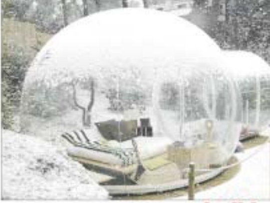
ပုန်လုံ အိမ်ခန်း