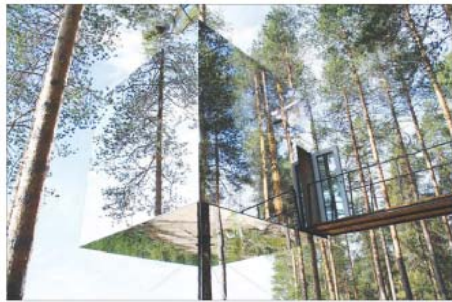
ပုန်ပျော်စင်