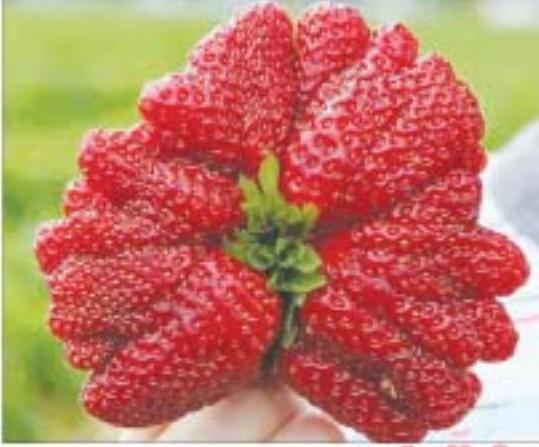
တော်ဘယ်ရီအပြာ