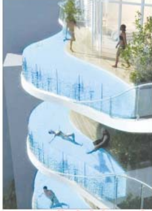
ဒုက္ခိဗု ပုဂံတယ်ဝန်တာ ရေကူးကန်