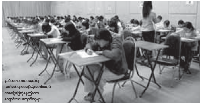
နိုင်ငံတကာအသိအမှတ်ပြု လက်မှတ်ရစာမေးပွဲစနစ်ပေးပို့ရာတွင် စာမေးပွဲဖြေဆိုနေကြစဉ်သာ ကျောင်းသားကျောင်းသူများ

ရန်ကုန်၊ အောက်တိုဘာ - ၃၀ အမေရိကန်နိုင်ငံရှိ တက္ကသိုလ်များတွင် ပညာသင်ယူလို့သူများ အတွက် ပညာရေးဟောပြောပွဲအား နိုဝင်ဘာ ၅ ရက်ညနေ ၅ နာ ရီမှ ၆နာရီခွဲအထိ ပါးစုံရိုင်ရယ်တိုတယ်၌ကျင်းပမည်စု Regent ပညာရေးကုမ္ပဏီမှ သိရသည်။