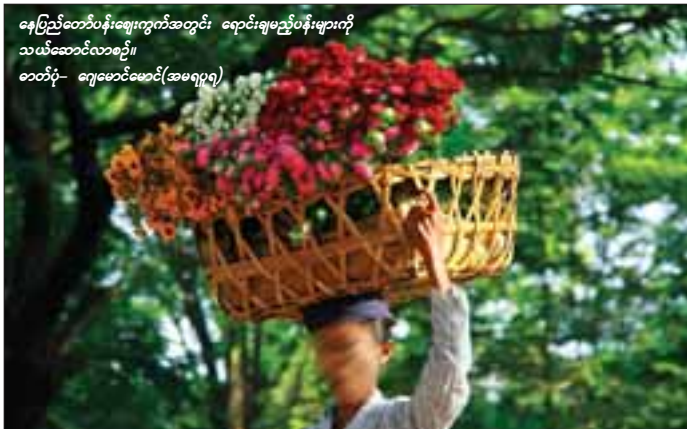
နေပြည်တော်ပန်းမျိုးကွက်အတွင်း ရောင်းချမည့်ပန်းများကို သယ်ဆောင်လာစဉ်။

နိုင်ငံခြား ပန်းမျိုးများတွင် အမေရိကန်ချစ်တီးပန်း၊ ပြင်သစ်