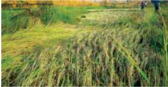
မာန်အောင်စရောင်ရာမှ ပျက်စီးနေသော လယ်ဧကများ တာတမံ - မေတော်လာအဖွဲ့

မြင့်မြတ်မြို့ ကျောက်ဖြူ အောက်တိုဘာ-၃၀ ရခိုင်ပြည်နယ်အတွင်း ဝင်ရောက် တိုက်ခတ်သွားသော ဂိရိမုန်တိုင်းကြောင့် ကျောက်ဖြူ မြေပုံ၊ ရမ်းဗြဲနှင့် မာန်အောင်စသော ဒေသများတွင် တာတမံများ ပျက်စီးပြီး ဆားငန်ရေ လွှမ်းမိုးခဲ့သည့်အတွက် လယ်ဧကများစွာ ပျက်စီးခဲ့ကြောင်း သိရသည်။