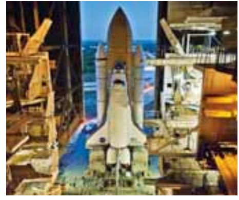
အတွင်းအချိန်ပြည့် နေထိုင်သွားမည်ဖြစ်သည်။ —Ref: Xinhua

မှအပိုယာဉ်မျိုးတစ်ဦး ယင်းအ ထဲတွင် နေထိုင်နိုင်ရန် တစ်ဦးစာ နေရာလွတ်ရှိသည်။ ထို့ပြင် ယင်းယာဉ်ငယ်အ စိတ်အပိုင်းတွင် အရည်ရူပဗေဒ၊ ခြံထုသိပ္ပံ၊ ဇီဝဗေဒ၊ ဇီဝနည်း ပညာဗေဒဆိုင်ရာ စမ်းသပ်မှုများ လည်း ပြုလုပ်နိုင်သည်။ ထို့ပြင် PMM တွင် အာကာသအတွင်း ပထမဆုံးနေထိုင်မည့် လူတူ ရှိ ဘော့စက်ရှင် ရှိတိုင်းကဲ့သို့ ၂ ကို လည်းသယ်ဆောင်သွားမည်ဖြစ် ကာ ယင်းစက်ရှင်မှာမူ အာကာသ