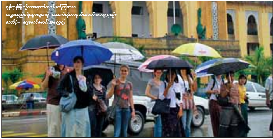
ရန်ကုန်မြို့သို့လာရောက်လည်ပတ်ကြသော ကမ္ဘာလှည့်ခရီးသွားများကို အောက်တိုဘာအထိယပတ်ကတော့ရစဉ်။

အောင်သူရ ရန်ကုန်၊ အောက်တိုဘာ - ၂၉ ဆိုက်ရောက်ပြည်ဝင်ခွင့် (Visa on Arrival) ဖြင့်လာရောက်ခြင်းကို စတင်ရပ်ဆိုင်းခဲ့သော စက်တင်ဘာလအတွင်းရန်ကုန်အပြည်ပြည်ဆိုင်ရာ လေဆိပ်မှ ဝင်ရောက်သောနိုင်ငံခြားသားဦးရေမှာ ဇူလိုင်နှင့် ဩဂုတ်လများထက် လျော့နည်းသွားကြောင်း မြန်မာနိုင်ငံခရီးသွားလုပ်ငန်းရှင်အသင်းမှ ထုတ်ပြန်သော စာရင်းများအရ သတင်းရရှိသည်။ စက်တင်ဘာလတွင် စုစုပေါင်း ၁၈,၀၉၄ ဦးဝင်ရောက်ခဲ့ပြီး ဩဂုတ်လထက် ၄၃၁၃ ဦးနှင့် ဇူလိုင်လထက် ၃၀၀၀ ဦးလျော့နည်းခဲ့ခြင်းဖြစ်သည်။ သို့သော် ၂၀၀၉ ခုနှစ် စက်တင်ဘာက ဝင်ရောက်သော ဦးရေနှင့် နှိုင်းယှဉ်ပါက ၄၀၉၃ ဦးတိုးလာခဲ့သည်။ ၂၀၁၀ စက်တင်ဘာလ၏ တစ်ရက်ပျမ်းမျှ ရန်ကုန်လေဆိပ်လာရောက်မှုမှာ ၆၀၃ ဦးရှိသည်။ ယခုနှစ် ဇန်နဝါရီလမှစ၍ စက်တင်ဘာလကုန်အထိ ကိုးလအတွင်းရန်ကုန်လေဆိပ်ဝင်ပေါက်မှု နိုင်ငံခြားသား စုစုပေါင်း ၂၀၁,၈၂၃ ဦး ဝင်ရောက်ခဲ့ပြီး ၂၀၀၉ ခုနှစ် အလားတူ ကာလက ၁၄၇,၁၆၉ ဦးသာ ဝင်ရောက်ခဲ့သဖြင့် ကိုးလခြင်းနှိုင်းယှဉ်ပါကင်းသောင်းကျော် တိုးလာခဲ့သည်။