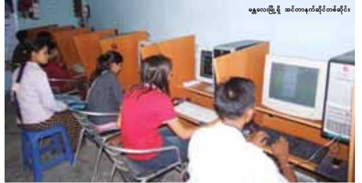
မန္တလေးမြို့ရှိ အင်တာနက်ဆိုင်တစ်ဆိုင်။

“လိုင်းတွေကျနေတော့ ဆိုင်ရဲ့ ဝင်ငွေကို တော်တော်ထိခိုက်ပါတယ်။ ပြီးတော့ ဆိုင်ခန်းက ငှားခတွေ့ ဝန်ထမ်းစရိတ်တွေက