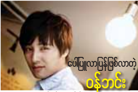
ပေါ်ပြူးလာပြန်ဖြစ်လာတဲ့ ဝန်ဘင်း