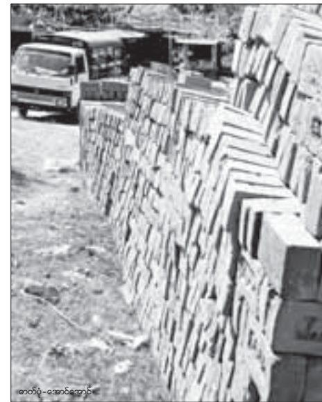
စက်ရုံ-အောင်တောင်

“ဈေးတက်သွားပေမယ့် အရောင်းအဝယ်ကတော့ ပုံမှန်ပါ။ ကျသွားတာမျိုး မရှိပါဘူး။ ဒီလို အုတ်ဖိုတွေပျက်သွားတော့ အုတ်ဈေးကတော့ ကျဖို့မလွယ်သေးဘူး။ ဆက်တက်ဖို့ပဲရှိမယ်” ဟု ၎င်းလုပ်ငန်းရှင်က ပြောသည်။