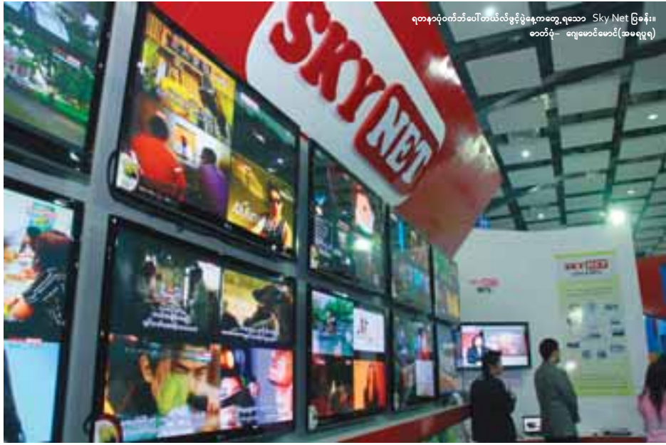
ရတနာပုံစံတံဆိပ်တယ်လီဖုန်းပုံစံကတော့ ရသေ့ Sky Net ဖြစ်နိုး။

တိုက်ရိုက်စနစ်နှင့် Video Conferencing လုပ်ငန်းများ၊ အင်တာနက်ဆက်သွယ်မှုစနစ်နှင့် တယ်လီဖုန်းဆက်သွယ်မှုလုပ်ငန်းများကိုပါဆောင်ရွက်လုပ်ကိုင်လာနိုင်မည့် Multiple-Play Choice အစရှိသည့်စနစ်မျိုးထဲမှ ကြိုက်နှစ်သက်ရာဝန်ဆောင်မှုကို ရွေးချယ်အသုံးပြုနိုင်ကြောင်း သိရသည်။ ၂၀၁၀ နိုဝင်ဘာလ လယ်တွင် စတင်ဝယ်ယူအသုံးပြုနိုင်တော့မည့် အဆိုပါ Sky Net ရုပ်သံလိုင်းသစ်သည် ပြည်တွင်း၏ ပုဂ္ဂလိကအသေးစားရုပ်သံလိုင်းများတွင်အဦးဆုံးလုပ်ကိုင်ခဲ့သော Family Entertainment ရုပ်သံလိုင်းဖြစ်ပြီး ဒုတိယမြောက်ထွက်ပေါ်လာသည့် ပုဂ္ဂလိကရုပ်သံလိုင်းသစ်ဖြစ်သည်။