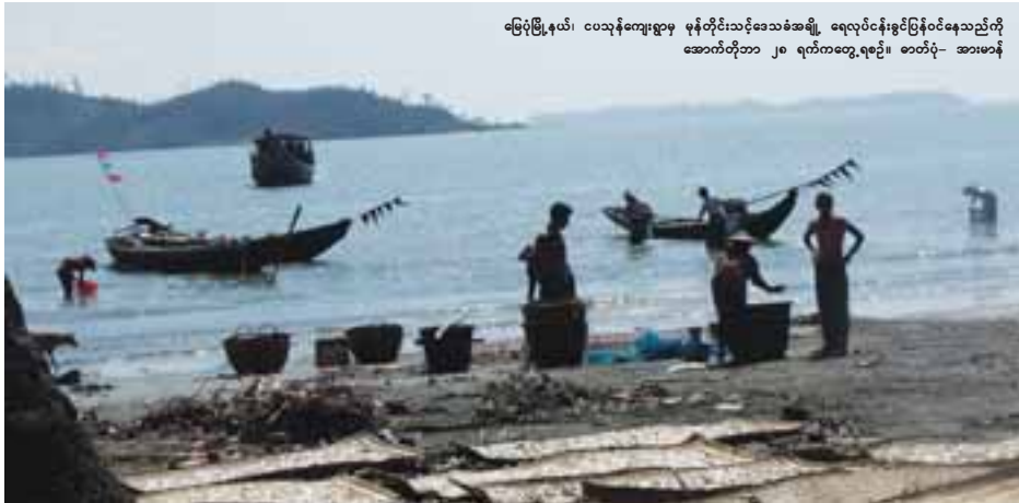
မြေပုံမြို့နယ်၊ ငပသန်ကျေးရွာမှ မုန့်တိုင်းသင့်ဒေသခံအမျိုး ရေလုပ်ငန်းရှင်ပြန်ဝင်နေသည့်ကို အောက်တိုဘာ ၂၈ ရက်ကတွေ့ရပုံ။

သန်းဌေး ရန်ကုန်၊ အောက်တိုဘာ- ၂၆ ဆိုင်ကလုနီးမုန့်တိုင်း ဂီရိဒဏ် ကြောင့် ငါး၊ ပုစွန်၊ သယ်ဇာတ ပေါများစွာ ထွက်ရှိသည့် ရခိုင် ပြည်နယ် ကမ်းရိုးတန်းဒေသများ ရှိ ရေလုပ်ငန်းများတွင် ဆိုးရွားစွာ ထိခိုက်ခဲ့ကြောင်း ငါးလုပ်ငန်းဦး စီးဌာန ညွှန်ကြားရေးမှူးချုပ် ဦးခင်ကို လေးက အောက်တိုဘာ ၂၆ ရက်တွင် ပြောကြားသည်။ “မြေပုံမြို့နယ်က ငါးလုပ် ငန်းဦးစီးရုံး ၉၀ ရာခိုင်နှုန်းပျက်စီး ခဲ့တယ်။ ကမ်းရိုးတန်းဒေသပျက်စီးမှု က လှေအစီး ၈၀ ပျက်စီးပြီး ကျောက်ဖြူပုစွန်သားပေါက်ကန် ပျက်စီးခဲ့တယ်။ မြေပုံက အဆိုးဆုံး ဖြစ်တယ်” ဟု ၎င်းက ပြောကြား သည်။ အလားတူ ကျောက်ဖြူမြို့၏ အနောက်မြောက်ဘက်ငါးခိုင်အ ကွာ ကျောက်တန်းပေါ်တွင်လည်း မလေးရွာနိုင်းအခြေစိုက် မြန်မာ နှင့်ဖက်စပ်ငါးဖမ်းလုပ်ငန်း ဆောင် ရွက်နေသော အမ်တီအိုကုမ္ပဏီ ပိုင်ကျွန်ပိုင်များတန်း ငါးဖမ်း ရေယာဉ်နှင့် ဗီယက်နမ်ကုမ္ပဏီ ပိုင် အမ်ပီပီပီဖျောင်းမွန်းကုန်တင် သင်္ဘောတို့လည်း တင်ကျန်နေ၍ ရေယာဉ်အမှုထမ်းများကို သွား ရောက်ကယ်တင်ခဲ့ရကြောင်း အောက်တိုဘာ ၂၆ ရက်ထုတ် နိုင်ငံပိုင်သတင်းစာများတွင် ဖော် ပြခဲ့သည်။ ထို့ကြောင့် အောက်တိုဘာ ၂၂ ရက်က စတင်တိုက်ခတ်ခဲ့သော