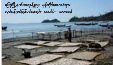
မြေပြိုမှု၊ ရေယိုမှုနှင့် မုန်တိုင်းဒေသခံများ လုပ်ငန်းခွင်ပြန်ဝင်နေစဉ်။ ဇာတိပုံ- အာမာန်

မောင်သန်းဝင်း စစ်တွေ၊ အောက်တိုဘာ-၂၇ ဘင်္ဂလားပင်လယ်အော်အတွင်း ဂီရိမုန်တိုင်း၏ လေဖိအားနည်းရပ်ဝန်းဖြစ်ပေါ်ချိန်က ရပ်နားခဲ့ရသော ရခိုင်ဒေသတွင်း ကမ်းနီးကမ်းဝေးပင်လယ်ပြင် ငါးဖမ်းလုပ်ငန်းများအားလုံးမှာ လုပ်ငန်းပြန်လည်လုပ်ကိုင်နေကြပြီဖြစ်ကြောင်း ရေလုပ်သား(တံငါသည်)များကပြောသည်။ ဂီရိမုန်တိုင်း၏အရှိန်ကြောင့် အောက်တိုဘာလ တတိယပတ်မှစပြီး ပင်လယ်မြစ်ချောင်းအင်းအိုင်ငါးဖမ်းလုပ်ငန်းများအတွင်း ကမ်းနီးကမ်းဝေးငါးဖမ်းသင်္ဘောရေယာဉ်များမှာ မုန်တိုင်းဒဏ်ခံရမှု ဆိပ်ကမ်းများသို့ စုပြုံဝင်ရောက်ကျောက်ချနေခဲ့ရသည်။ အောက်တိုဘာ ၂၇ ရက်မှစ၍ ငါးဖမ်းသင်္ဘောရေယာဉ်များမှာ မိမိတို့ဌာနေငါးဖမ်းလုပ်ငန်းများအတွင်း ဝင်ရောက်ဖမ်းဆီးကာ စားသုံးသူဈေးကွက်သို့ ငါး ပို့ပို့များသို့ ပို့နေကြပြီဖြစ်ကြောင်းလည်း သိရသည်။